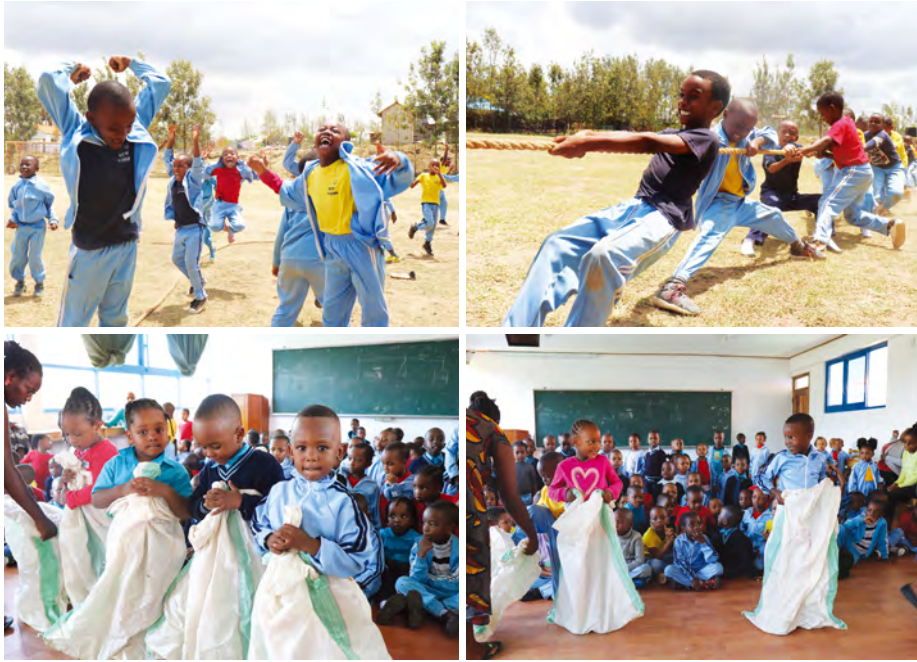
뉴비전 사업장에서는 매년 전교생을 대상으로 체육대회 를 진행합니다. 체육대회에 참석한 아동들 모두 특별한 추억을 만들고 친구들과 더욱 돈독해지는 즐거운 시간이 되었길 바랍니다.