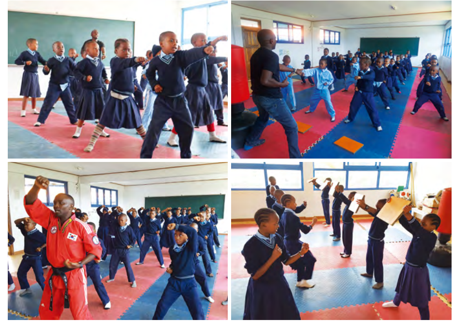
하나, 둘, 셋! 아동들의 우렁찬 목소리가 들립니다. 가장 인기 있는 수업종 하나인 태권도 수업 을 배우고 있습니다. 한국의 스포츠를 배우며 더 건강하고 씩씩한 아동들로 성장하기를 바랍니다.