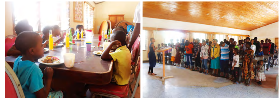
튜마이니 사업장의 아동들은 토모모임행사 를 통해 다 같이 모여 점심을 먹고, 레크리에이션, 새 학기 계획세우기 등 다양한 프로그램을 하며 즐거운 시간을 보냈습니다.