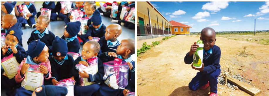
지난 하반기 선물금캠페인 을 통해 신기다 뉴비전 사업장에서는 후원자분들이 보내주신 선물금으로 아동들에게 깨끗한 물을 마실 수 있는 물병과 학용품을 선물하였습니다.