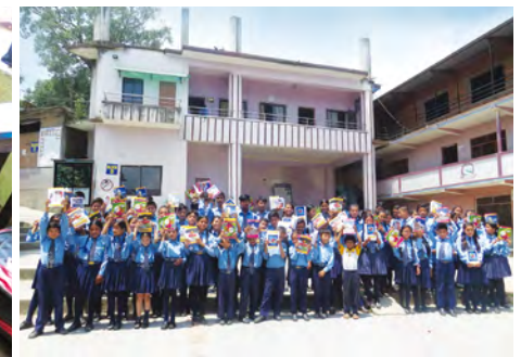
네팔 사업장에서는 아동들의 배를 든든하게 채워주기 위해 중식 지원 을 하고 있으며, 형편이 넉넉하지 않아 학용품을 구비하지 못하는 아동들에게 새 학용품 지원 을 하였습니다.