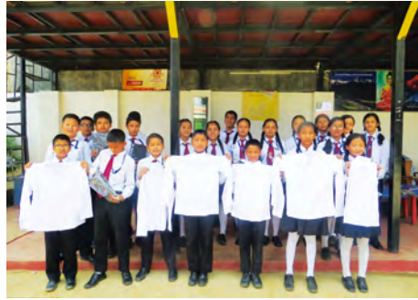
네팔 사업장에서는 새학기를 맞이하여 아동들에게 교복지원 을 하였습니다. 각자 맞는 사이즈를 입어보며 즐거워 하는 아동들의 모습을 볼 수 있었습니다.