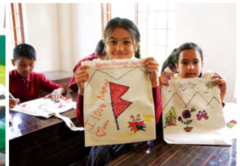
지난 8월, 후원자해외사업장 방문 이 네팔 사업장에서 진행되었습니다. 하회탈 만들기, 장아-비장에 아동 운동회, 에코백 그리기 등 많은 활동을 하며 아동들에게 좋은 추억을 선물하였습니다.