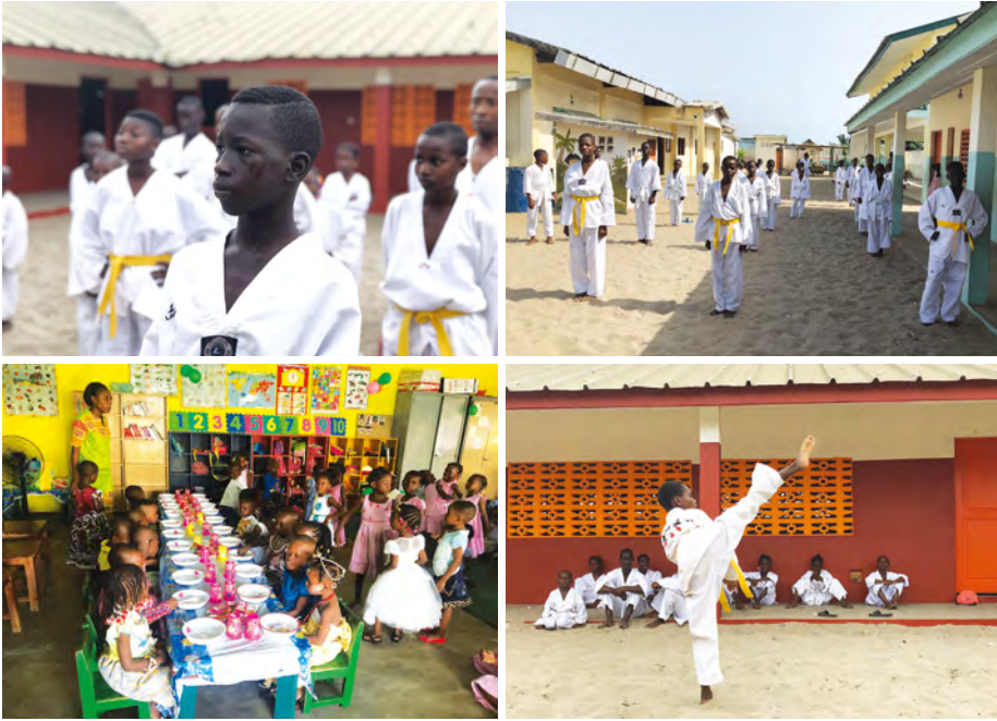
2015년부터 진행된 태권도 수업 은 벨빌 초등학교에서 제일 인기 있는 수업입니다. 아동들은 곧 있을 승급 심사를 위해 열심히 연습하고 스스로를 단련하며 승급에 만전을 기하고 있습니다.