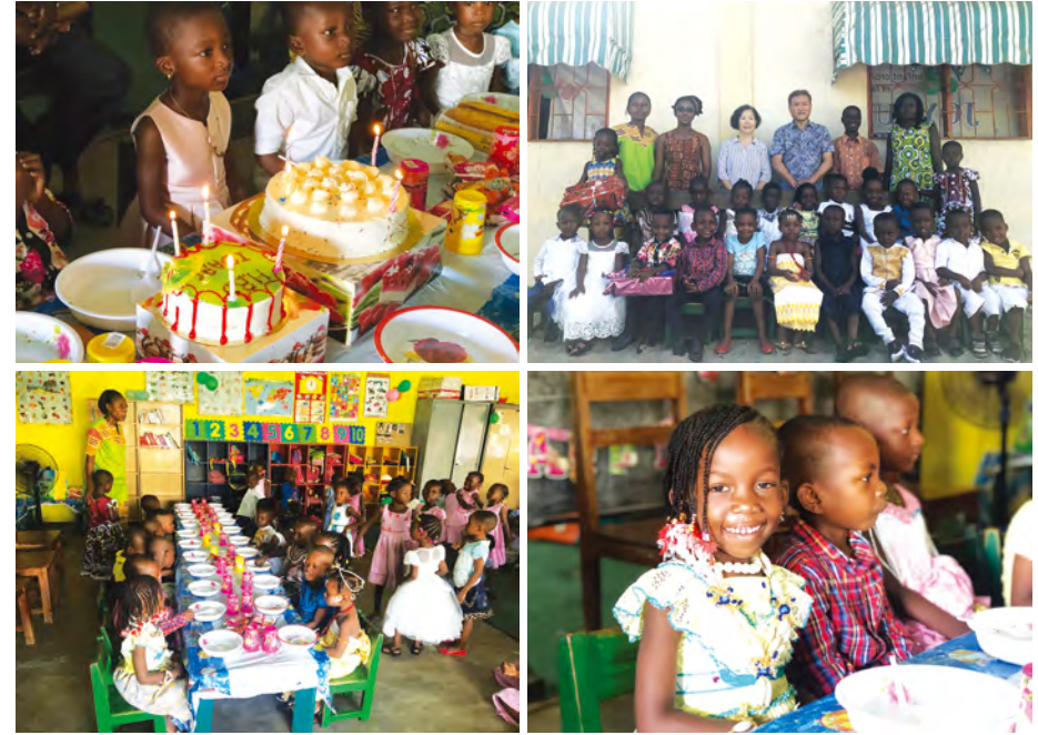
매년 진행되는 생일파티 는 아동들에게도 부모님들에게도 잊지 못할 중요한 행사로 자리매김 되고 있습니다. 생일의 주인공들은 화려한 전통의상을 입고 등교를 하고 친구들은 다 함께 축하해주고 있습니다.