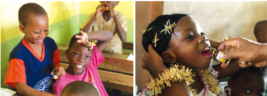
열악한 위생환경에 노출되어 있는 아동들을 위해 매년 의약품 을 지원하고 있습니다. 어린 아동들은 약을 잘 먹지 않아 선생님들이 직접 먹여주며 전교생 아동들이 구충제와 비타민을 제공받았습니다.