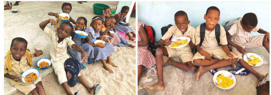
대부분의 아동들은 하루에 한 끼만 먹거나 먹지 못하는 경우가 많습니다. 벨빌 초등학교에서는 아동들의 건강한 성장을 돕기 위해 영양가 있는 급식 을 지원하고 있습니다.